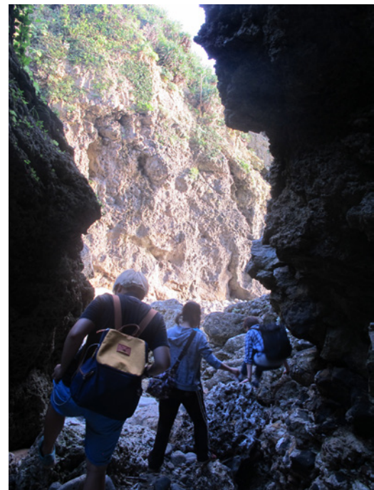
右圖：追尋新的體驗是小幫手認為最重要的價值。