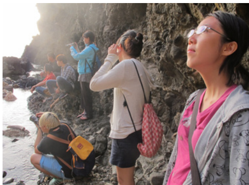
左圖：來自不同環境、不同背景的小幫手，因為打工換宿的身分而有伙伴的共識，無論熟識或不熟識的小幫手在難得共同的休息時間會相約嘗試新的體驗